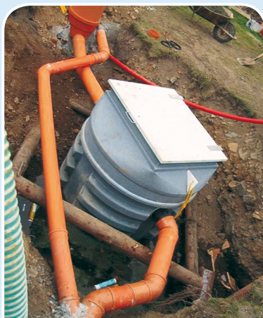
AS-VARIOcomp K ULTRA

Jednotlivé výrobky sestavy lze použít i samostatně.