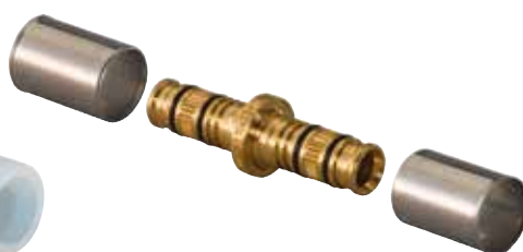
Rapex lisovací spojky